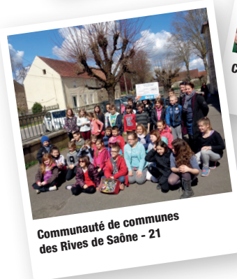
Communauté de communes des Rives de Saône - 21

Concours inter-école à La Chaumière - 130kg de piles collectées en une semaine par l'école.