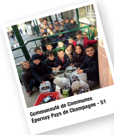
Communauté de Communes Épernay Pays de Champagne - 51

Dans le cadre de la Semaine européenne de la réduction des déchets, 468 enfants scolarisés dans 20 classes de la Communauté de Communes ont collecté 1,8 tonne de piles usagées , soit une moyenne de 3,8 kg de piles par enfant .