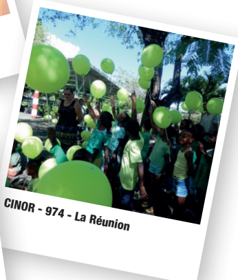
CINOR - 974 - La Réunion

Dans le cadre de la Semaine européenne de la réduction des déchets, 468 enfants scolarisés dans 20 classes de la Communauté de Communes ont collecté 1,8 tonne de piles usagées , soit une moyenne de 3,8 kg de piles par enfant .