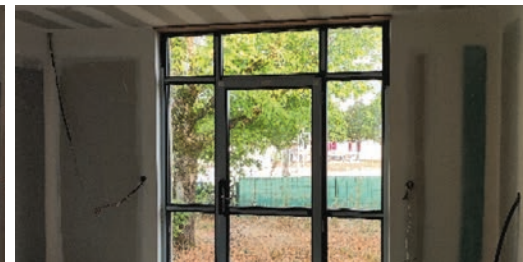
Les travaux de rénovation de la maison médicale