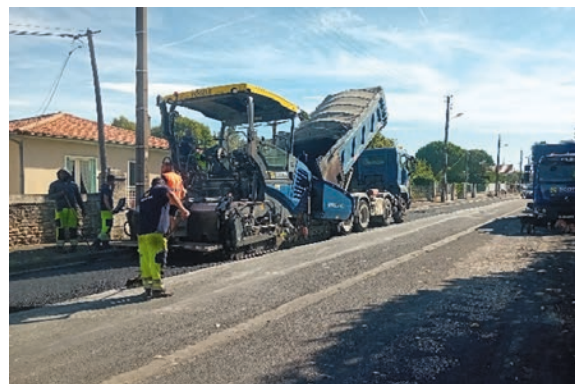
Travaux de revêtement de l'avenue Kennedy