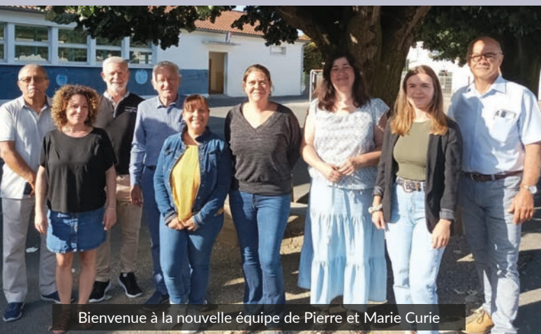
Bienvenue à la nouvelle équipe de Pierre et Marie Curie

406 élèves ont fait leur rentrée le 4 septembre dernier dans nos écoles. Ce sont environ 25 élèves de moins que l'année scolaire 2022-2023, ce qui marque la baisse constante des effectifs scolaires sur la commune. Ils devraient néanmoins se stabiliser autour des 400 élèves en attendant certainement une progression des inscriptions lorsque les divers projets immobiliers verront le jour. La réorganisation des groupes scolaires prévoit à terme une capacité d'accueil de 525 élèves, de quoi préparer l'avenir sereinement !