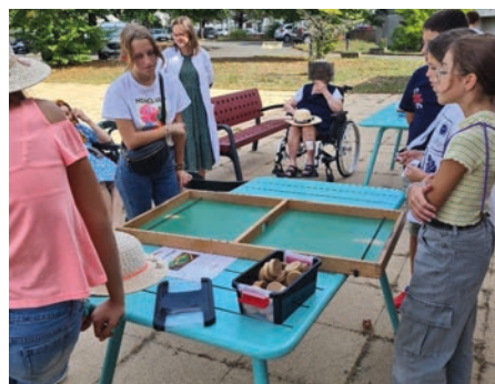
Enfants et résidents réunis autour des jeux

L'équipe encadrante de la Providence et les élus municipaux espèrent renouveler cet événement au printemps.