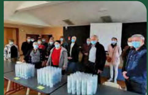
Remise des gobelets aux présidents d'association par le bureau municipal

Dans une démarche de protection de l'environnement et en partenariat avec CALITOM, la municipalité a souhaité doter les associations qui le souhaitent de gobelets réutilisables pour l'organisation de leurs activités ou manifestations.