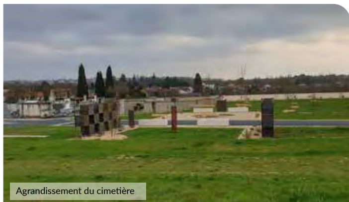
Agrandissement du cimetière