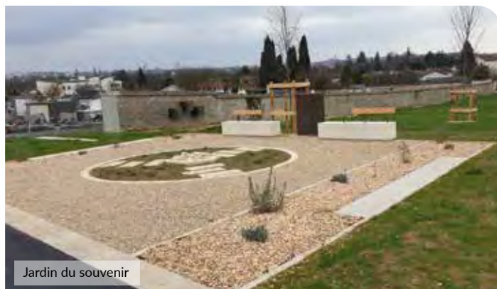
Jardin du souvenir

Après plusieurs mois de travaux, la rénovation et l'agrandissement du cimetière de Roffit arrivent à leur terme. Cette partie nouvelle s'étend sur 10 000m 2 portant la surface totale à plus de 29 000 m 2 . 630 concessions, 220 cavurnes et 130 cases réparties dans une douzaine de columbariums, le jardin du souvenir et un puits de dispersion sont dès à présent disponibles.