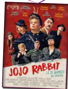
Jojo Rabbit - cinéma DVD