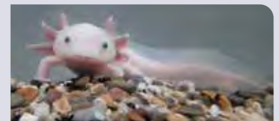
Axolotl, présent dans plusieurs Aquariums du club sciences