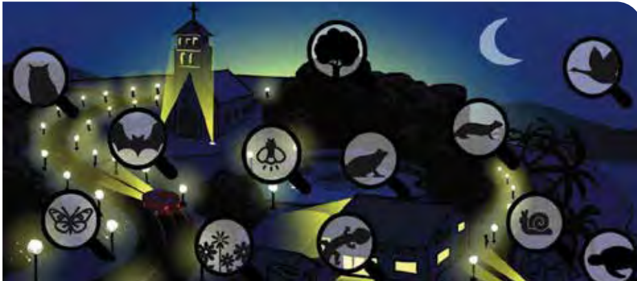
Les espèces touchées par la pollution lumineuse. (ADEME 2019)