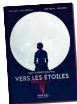
Lady Astronaute 1, Vers les étoiles de Mary Robinette Kowal Littérature / Roman