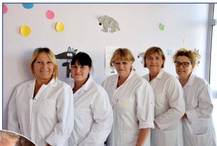
Office du Treuil