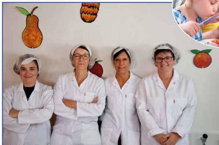
Office de Roffit