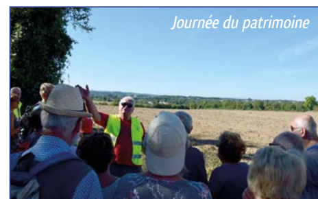
Journée du patrimoine