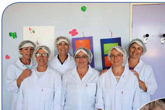
Office du Pontouvre