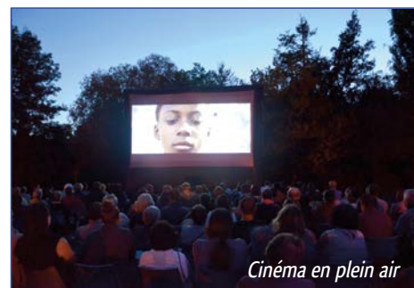
Cinéma en plein air

Encouragée par le bon déroulement de cette première édition, la municipalité avec le concours du Conseil des sages, pense déjà à programmer une nouvelle édition dans un autre quartier de la commune en 2019.