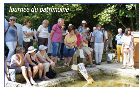
Journée du patrimoine