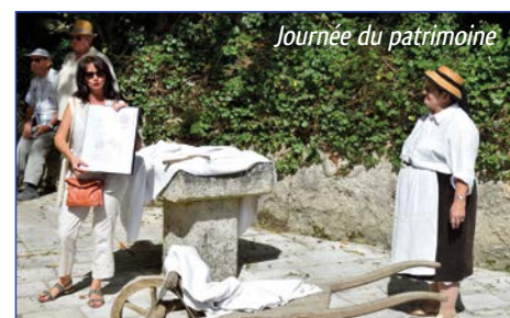
Journée du patrimoine