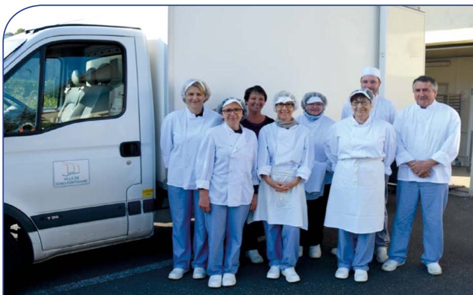
Equipe de la Cuisine Centrale devant le camion de livraison

N'oublions pas que la restauration c'est avant tout donner du plaisir et c'est dans cet esprit que l'équipe municipale accompagne l'ensemble de nos agents, du cuisinier à l'agent de service, qui s'activent quotidiennement auprès des enfants.