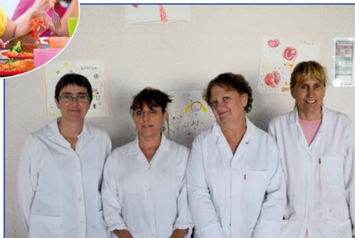
Office du Gond