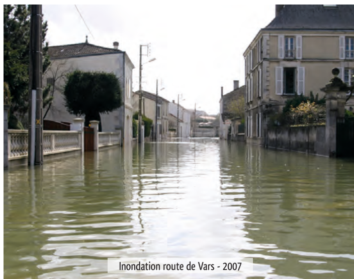
Inondation route de Vars - 2007

Outre le recensement et la situation de ces risques potentiels sur le territoire de la commune, le D.I.C.R.I.M présente également les mesures d'ordre général qui sont prises par les pouvoirs publics à titre préventif, mais aussi les mesures particulières qui ont été réalisées par la municipalité pour éviter qu'un incident ne se produise. Le but étant de pouvoir réduire les conséquences d'un éventuel événement, dans un souci permanent de protection des populations.